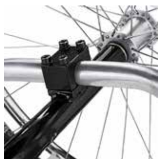
Possibilita o ajuste ideal do centro de gravidade