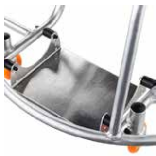
Plataforma para os pés ajustável individualmente