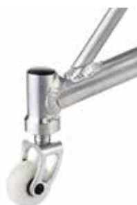
Rodízios duplos firmemente soldados ao chassi