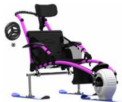
Adaptação para a neve