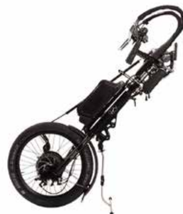
Sistema de acoplamento