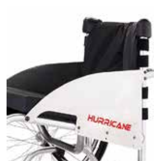
Chassi estável e seguro